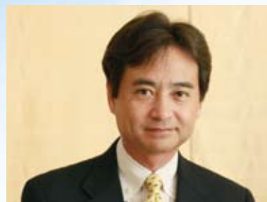
ごきそ腎クリニック 院長

医療・介護を総合的に提供する医療法人生寿会ならではの安心なサポート体制で、透析患者様とご家族様の幅広いご要望にお応えしてまいります。