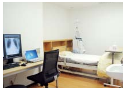
感染症に対応した個室透析

風を感じない、かつ加湿を施された上質空調とLEDのやさしい照明により、透析中の不要素を極力取り除き、一年を通して快適で心地よい環境を実現しました。