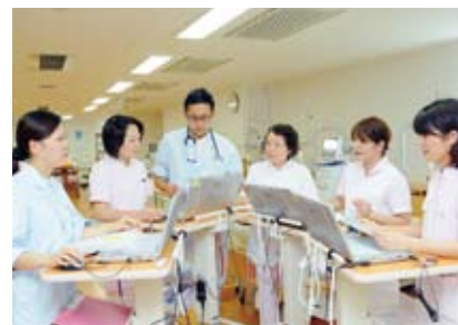
スタッフカンファレンス

およそ30年にわたり透析医療とともに歩んでいる生寿会のこだわりとノウハウをもとに、患者様ひとり一人に応じた医療・ケアを提供しています。