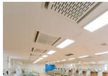
風を感じない調湿空調とLED照明

「透析液の清浄度」は透析の質に大きく影響します。当院では、最先端の透析液清浄化技術を導入し、患者様のからだへの負担軽減、合併症の予防への取り組みを続けています。