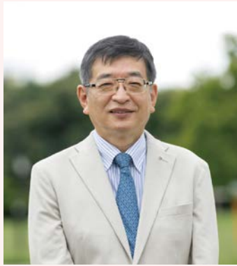
かわな病院在宅ケアセンター長 覚王山内科・在宅クリニック 院長